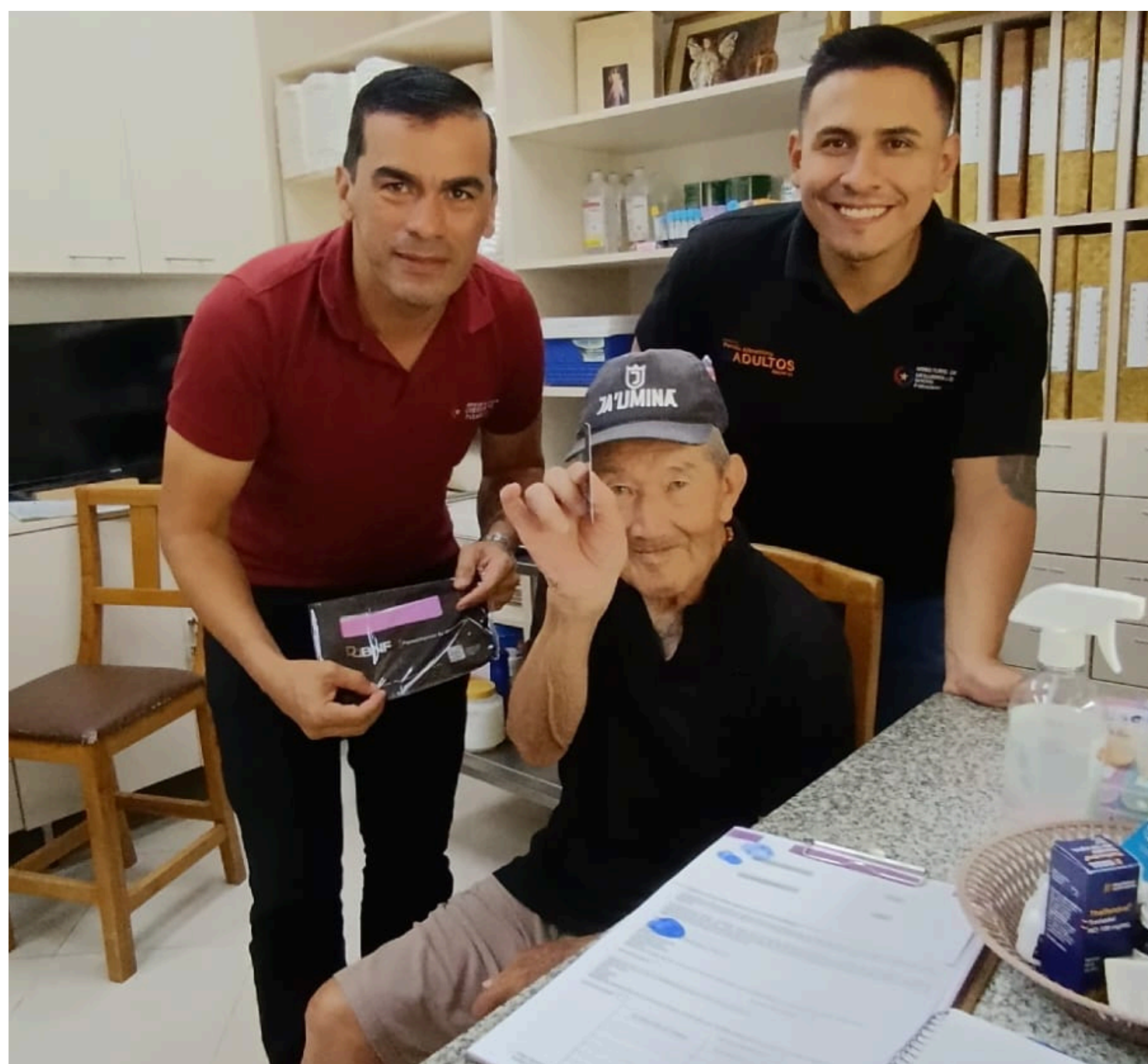
El Adulto Mayor exhibe la tarjeta que recibió del Correo Paraguayo.

Como se podrá observar, los servicios postales que el Correo Paraguayo está prestando a la ciudadanía son significativos. Es para garantizar que los compatriotas cuenten con sus tarjetas y de esa manera puedan realizar las transacciones financieras posteriores.