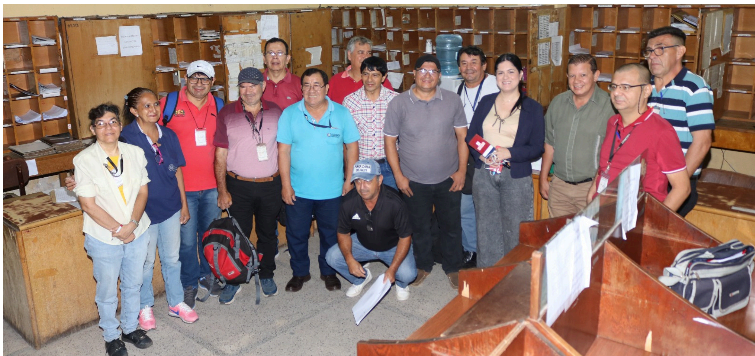
Los compañeros carteros posan en la oficina de distribución después de la entrevista con Paraguay TV.

Sin embargo, los propios trabajadores destacan que, más allá de la tecnología, la esencia del oficio permanece intacta: recorrer calles, conocer personas y ser portadores de noticias. Las vivencias de los carteros reflejan una profesión que combina rutina y sorpresa.