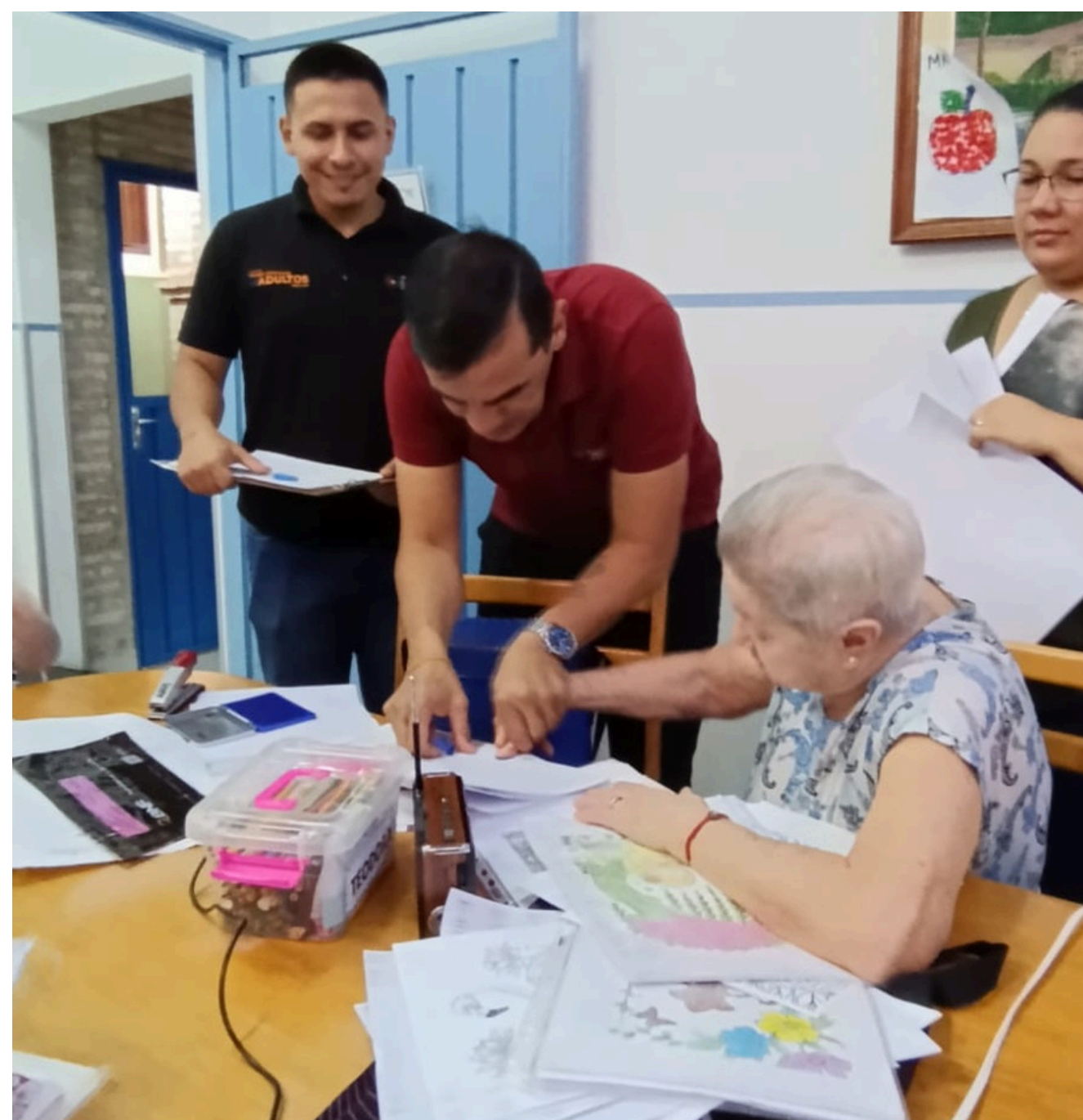
Los compañeros del Correo estuvieron acompañados de funcionarios del Ministerio de Desarrollo Social (MDS).