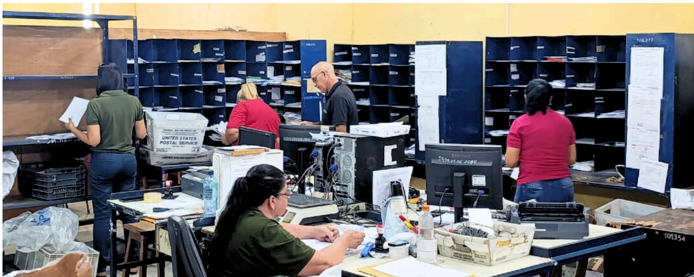
Los compañeros realizan sus tareas en la oficina del Centro de Tratamiento Postal (CTP).

En todo lo señalado participan activamente los inspectores asignados por la Asesoría de Seguridad Postal de la Dinacopa. Es para realizar las delicadas tareas de verificar, controlar, proteger e informar sobre las condiciones de los despachos receptionados del exterior.