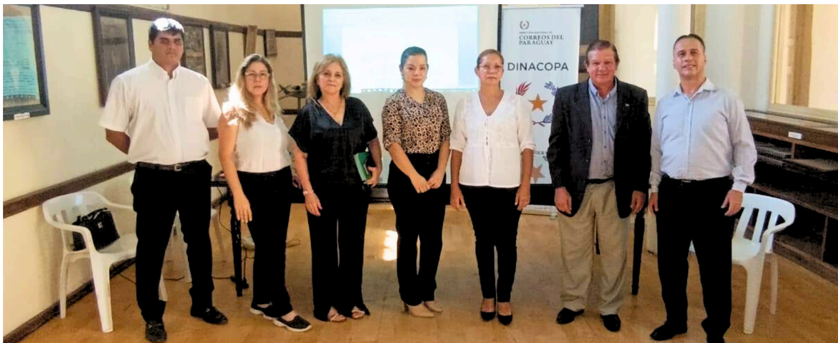
Los integrantes del Comité posan para la foto tras el análisis del plan de actividades para el período 2026.

Los integrantes del Comité de Rendición de Cuentas al Ciudadano (CRCC), de la Dirección Nacional de Correos del Paraguay (Dinacopa), analizaron el plan de acciones para este 2026.