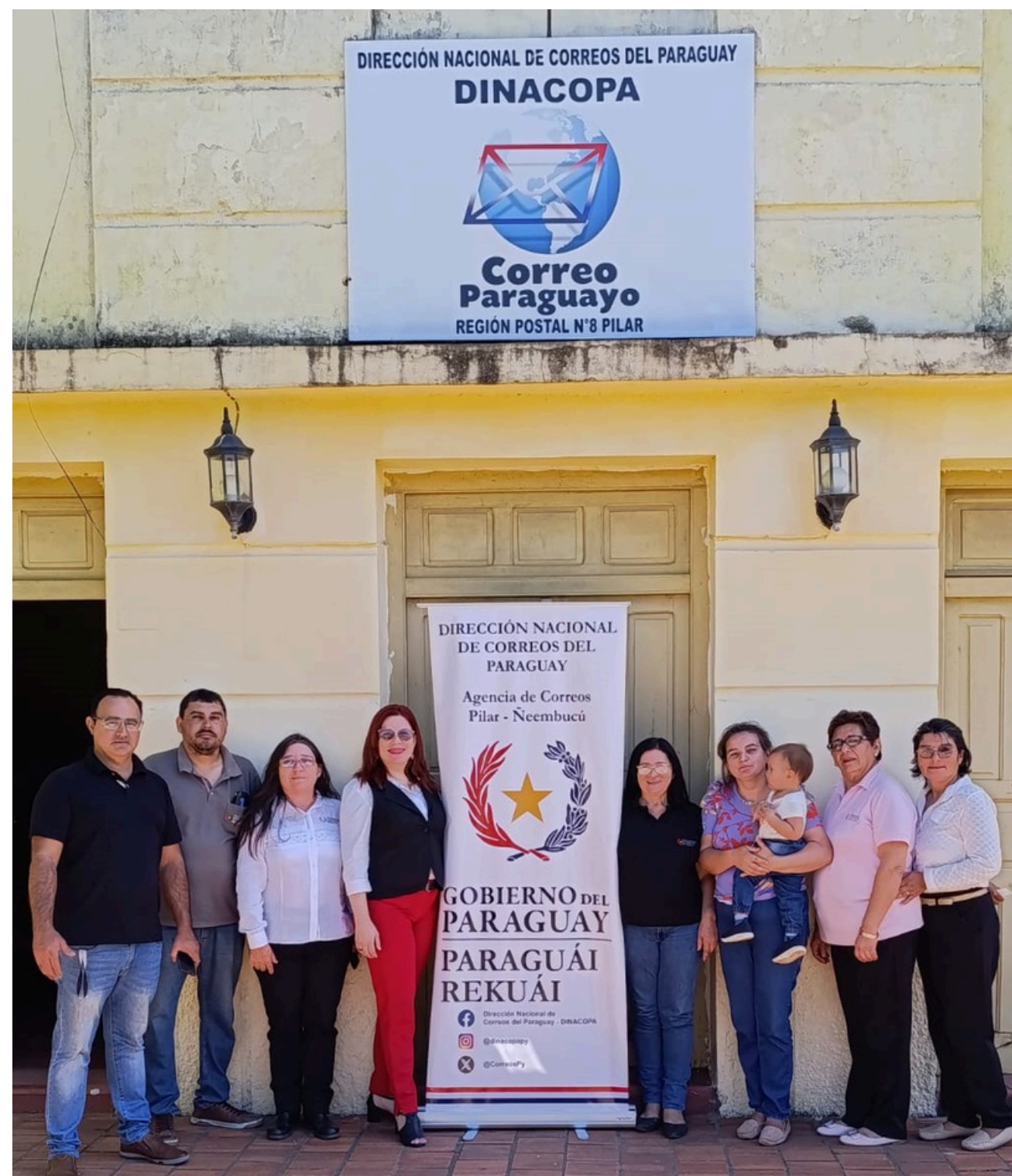
Socialización de los códigos y las políticas del Correo Paraguayo con los compañeros de la octava región postal

Los expositores destacaron la importancia de que los servidores públicos del Correo Paraguayo posean un conocimiento sólido de los códigos, reglamentos y políticas institucionales para garantizar un servicio eficiente, transparente y confiable.