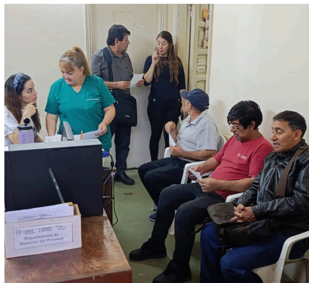
Los asistentes recibieron sus anteojos y destacaron la calidad de la atención recibida.