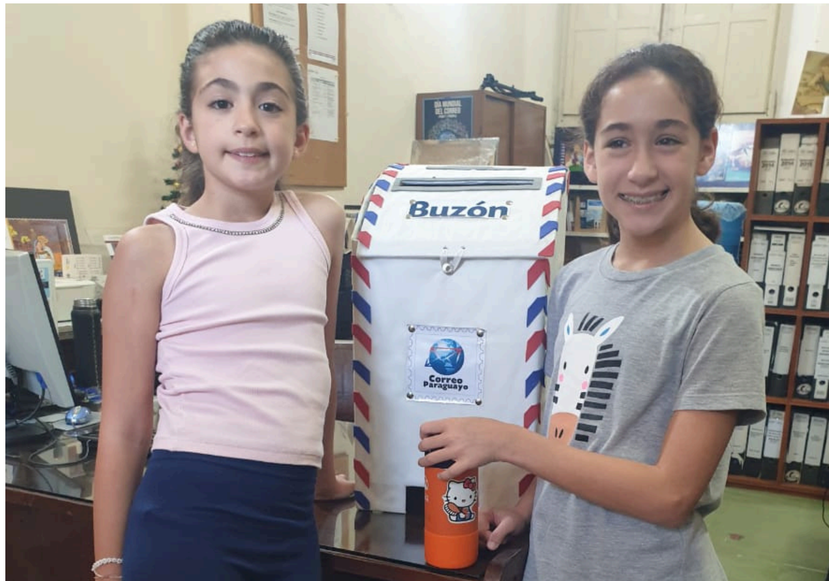
Las protagonistas de esta hermosa historia posan con el buzón que contiene las correspondencias.

En la era de los mensajes instantáneos y las alternativas digitales, una tradición resiste con firmeza en muchos hogares del mundo. Es enviar una carta postal física a Papá Noel.