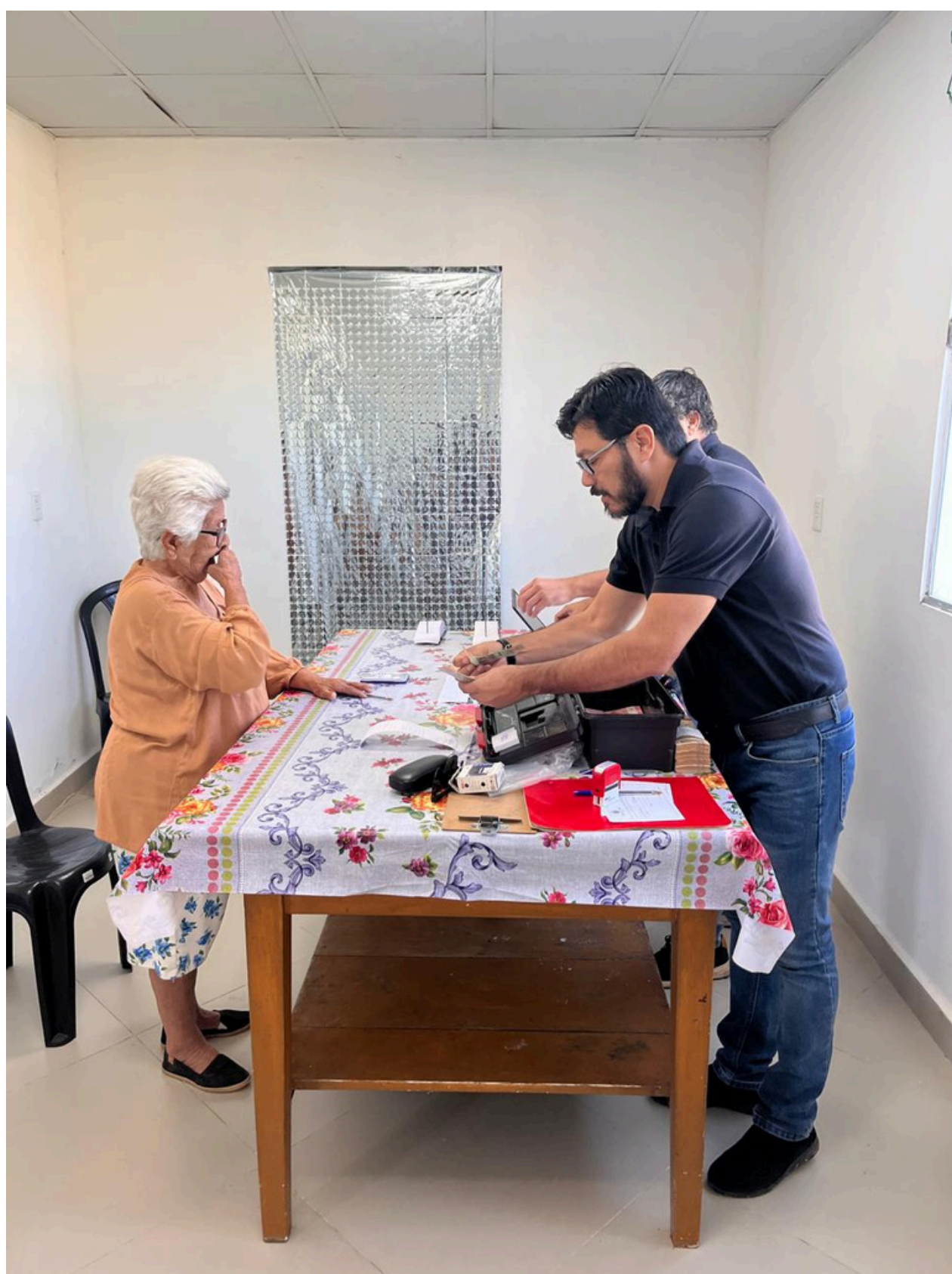
Los compañeros del Correo Paraguayo realizan los pagos a los jubilados y pensionados en sus respectivos domicilios.

Como se podrá observar, los servicios postales que el Correo Paraguayo está prestando a la ciudadanía son indispensables para garantizar que los compatriotas cuenten con disponibilidad de efectivos y de esa manera puedan realizar sus transacciones financieras posteriores.