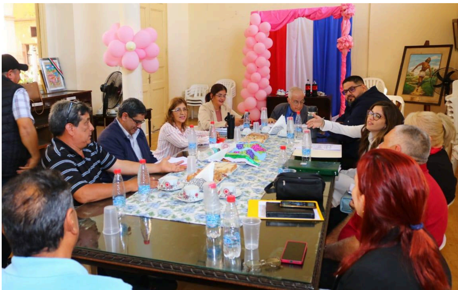
Se instaló la mesa de trabajo para el estudio del reglamento interno.

Una mesa de trabajo, para el estudio del reglamento interno de la Dirección Nacional de Correos del Paraguay (Dinacopa), se conformará con representantes de la dirección general y los diferentes sindicatos.