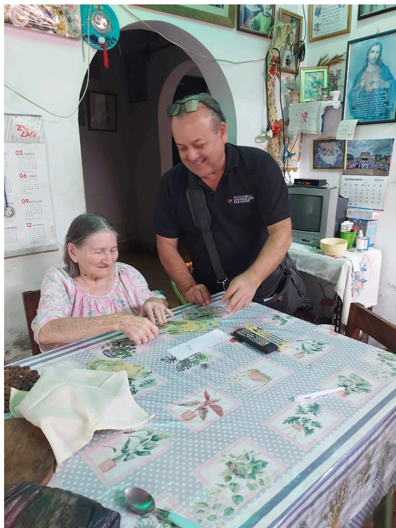
El rol social que cumple la entidad postal es significativo.